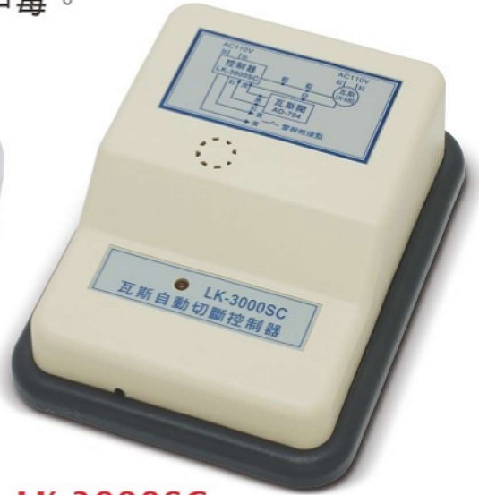
LK-3000SC 瓦斯自動切斷控制器